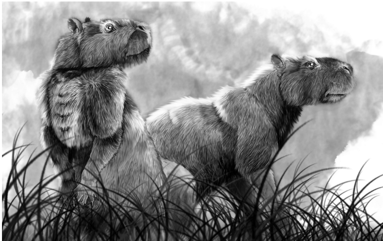
Figura 16.2. Reconstrucción artística de Phoberomys pattersoni , del Mioceno tardío de la Formación Urumaco, Estado Falcón. Dibujo de Jorge González, reproducido con gentil permiso de la Indiana University Press (Sánchez-Villagra y colaboradores 2010).

El parámetro más común que usan los biólogos y paleontólogos cuando se refieren al tamaño de los mamíferos es el peso corporal. En el caso de los fósiles, el mismo debe ser estimado basándose en comparaciones con el tamaño de los huesos de ani-