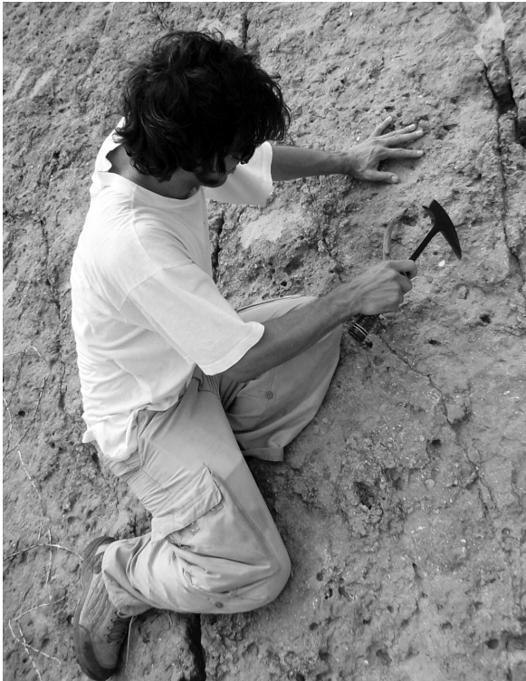
Figure 14.4. Extracción de muestras de huevos de tortuga de una capa de areniscas en la localidad de Domo de Agua Blanca, en la base del miembro superior de la Formación Urumaco. De esta localidad proviene el caparazón completo de la tortuga Bairdemys venezuelensis , expuesto en la Casa de La Cultura de Urumaco.

género Bairdemys , molariformes aislados de roedores, cráneos de caimanes ( Mourasuchus nativus y Caiman brevisrostris ), caparazón de tortuga matamata ( Chelus sp.), fémures de roedores, vértebras de serpientes ( Eunectes ) aún in situ , cráneo y mandíbula de Purusaurus mirandai , caparazón de tortuga gigante Stupendemys geographicus , vértebras de serpientes ( Eunectes ), abundantes coprolitos y otolitos. En las arenitas finas con fragmentos de conchas del lado norte de la estación de bombeo de PDVSA, al oeste la localidad de Norte de Las Huertas, se conoce un plastrón (peto o pecho de