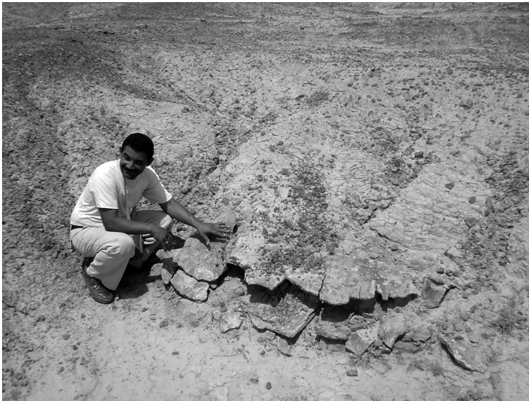
Figure 14.3. El autor en el campo de la Formación Urumaco, al lado de un ejemplar sólo parcialmente visible de la tortuga gigante Stupendemys geographicus.

El miembro superior de la Formación Urumaco es el resultado de depósitos de planicies deltaicas; los intervalos de lodos ricos en materia orgánica y carbón sugieren depósitos en áreas de planicies inundadas. La influencia marina en este miembro se