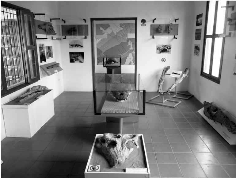
Figura 14.1. Parte de la exposición de los fósiles en la Casa de La Cultura en Urumaco.

La localidad de Cerro Alto, a 12 km al este de Quebrada Honda, aportó al registro fósil una asociación de restos pertenecientes a un milodóntido indeterminado (cráneo, fragmento de mandíbula, diente, humero y vértebras), un resto craneano de un cocodrilo, un fémur de otro milodóntido aún in situ , y un húmero de