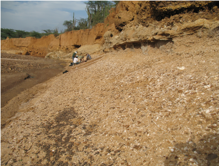
Figure 14.2. La Coquina, una localidad del miembro inferior de la Formación Urumaco rica en vertebrados e invertebrados.

En la coquina del camino a la meseta en la misma quebrada se ha podido observar una asociación faunística de varios grupos de vertebrados producto de aportes tanto marinos como continentales. De esta localidad provienen varias vértebras de serpientes, principalmente Eunectes (Hsiou. comunicación personal), mandíbulas parcialmente completas de un caimán de rostro corto, dos molariformes de roedores pequeños (en estudio isotópico), placas neurales de tortugas, dientes de varias especies de tiburón, dientes de rayas y una placa dérmica de cachicamo extinto pampatérico. Todo este material presenta un buen estado de preservación. Allí se encuentra también una abundante fauna de moluscos. El miembro inferior de la Formación Urumaco se extiende de este a oeste y en la región de Barranco Blanco al sur - este de Urumaco. De allí se rescató una tortuga Bairdemys sp. a 30 m al sur de la