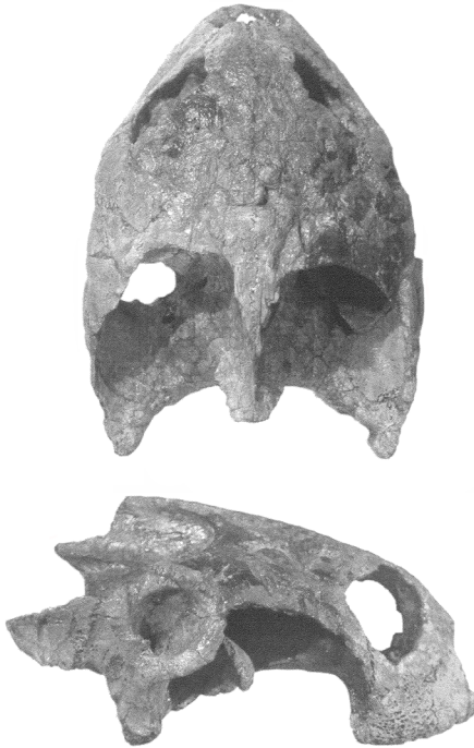
Figure 14.5. El cráneo de la tortuga marisquera Bairdemys sanchezi, en vista dorsal y lateral, de longitud 62 mm. Especie descrita por Gaffney y colaboradores en 2008.

En contacto concordante suprayace la Formación Codore (Mioceno tardío – Plioceno temprano). Los depósitos de lodolitas rojas y abigarradas (moteadas) del Miembro el Jebe sugieren ambientes de planicies de inundación y períodos largos de tiempo de exposición sub-aérea (Quiroz y Jaramillo 2010). Estas condiciones ambientales no fueron fructíferas para el buen desarrollo y preservación de la fauna. De esta formación solo se cuenta con tres localidades fosilíferas: (1) Camino a Tío Gregorio, donde se han exhumado placas dérmicas y un fragmento del paladar del arma-