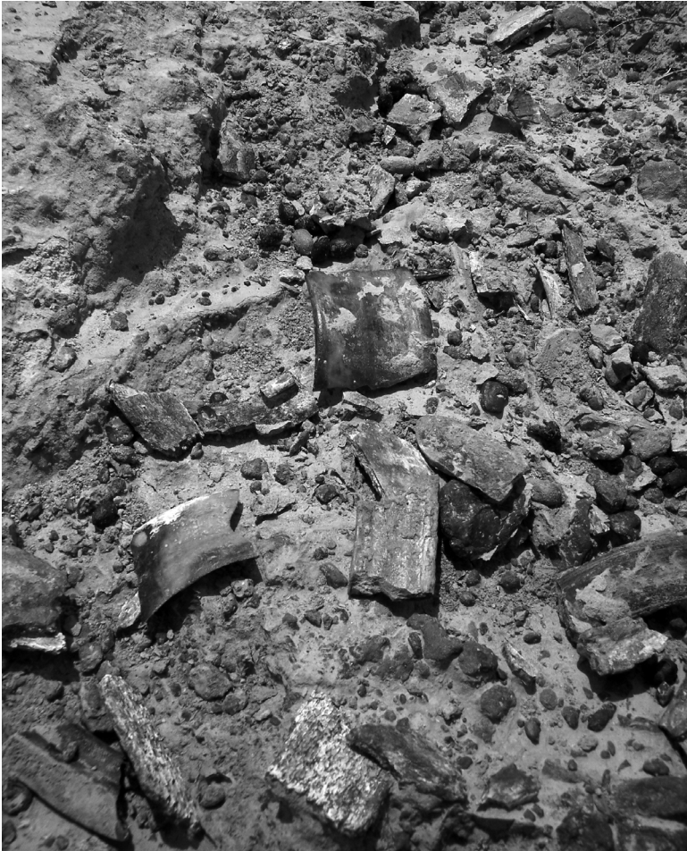
Figure 14.6. Restos de dientes rotos de toxodonte en el campo, de la Formación San Gregorio, miembro inferior, Plioceno, Estado Falcón.