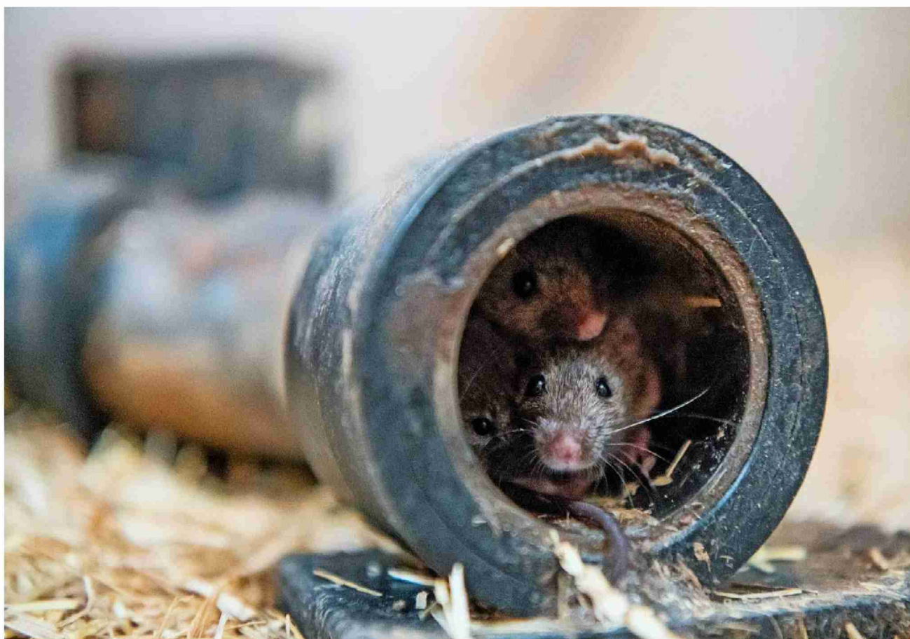
Die Mäuse schrecken heute vor Menschen weniger zurück als früher.

In einer langjährigen Studie mit Mäusen zeigen Biologen aus der Schweiz erstmals, wie wilde Tiere ohne menschliches Zutun zahm werden. Die Nager sind kleiner geworden und haben ein fleckiges Fell entwickelt.